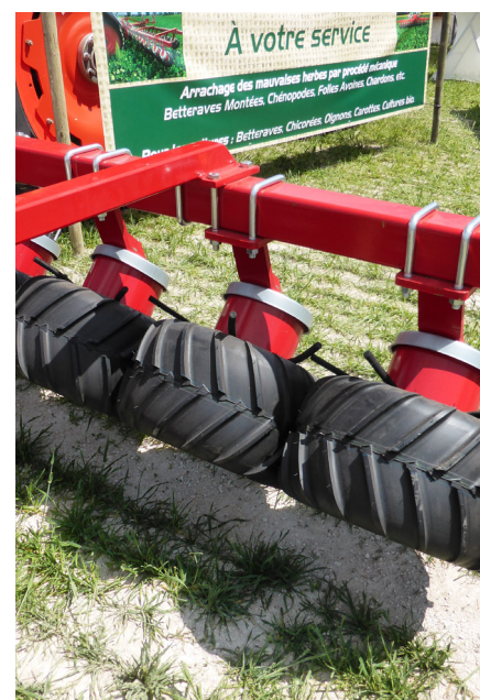
Figure 6. Désherbeuse à pneus Klünder

Fiche réalisée en mars 2022, dans le cadre des travaux du Comité Technique Régional AB Hauts-de-France