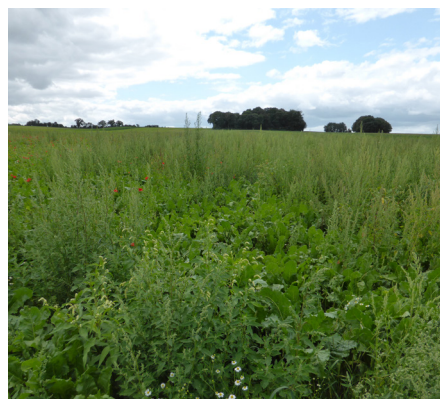
Figure 2 - Warluis semis du 27 avril 2021

Dans nos suivis, les semis retardés après la mi-mai, permettent de réduire significativement la présence des adventices en culture. Pour autant, les pertes de potentiels observées sont