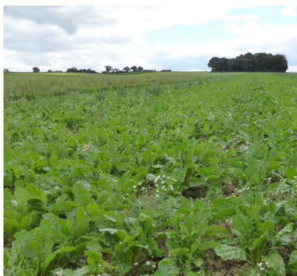
Warluis semis du 1 er juin 2021

Les techniques innovantes font l'objet de travaux qui seront poursuivis en