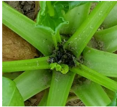
Indice de présence de teigne

Produits utilisables : Karaté Zéon 0.0625 l/ha, Ducat 0.3 l/ha, Décis Protech 0.5 l/ha.