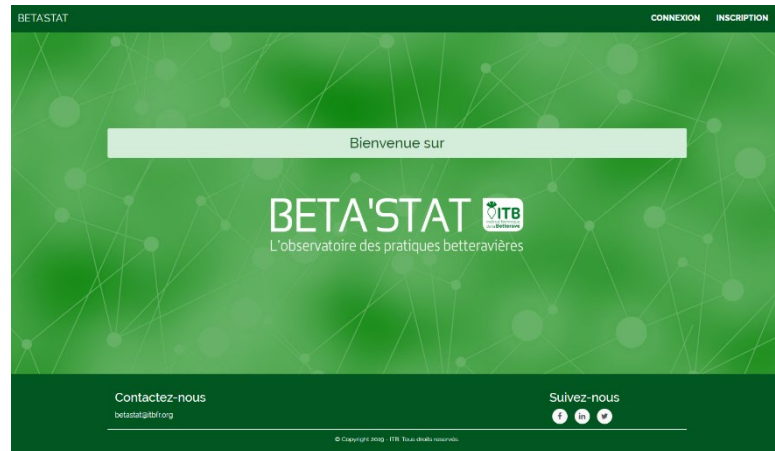
Page d'accueil de BETA'STAT

BETA'STAT est conçu pour répondre à ses problématiques.